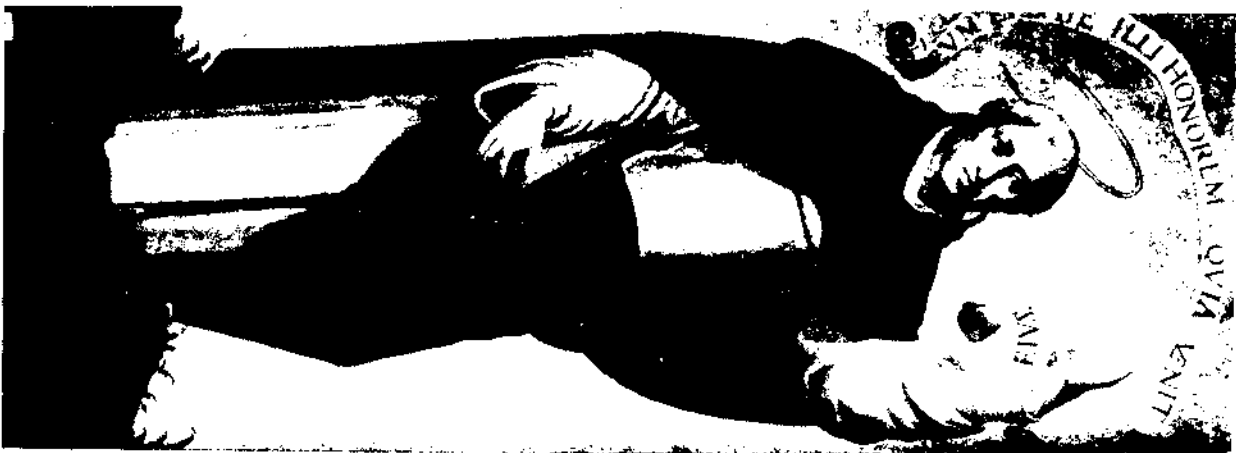
Convento de las Adoratrices, Valencia. San Vicente Ferrer, del "Taller o círculo de Joan de Joanes".