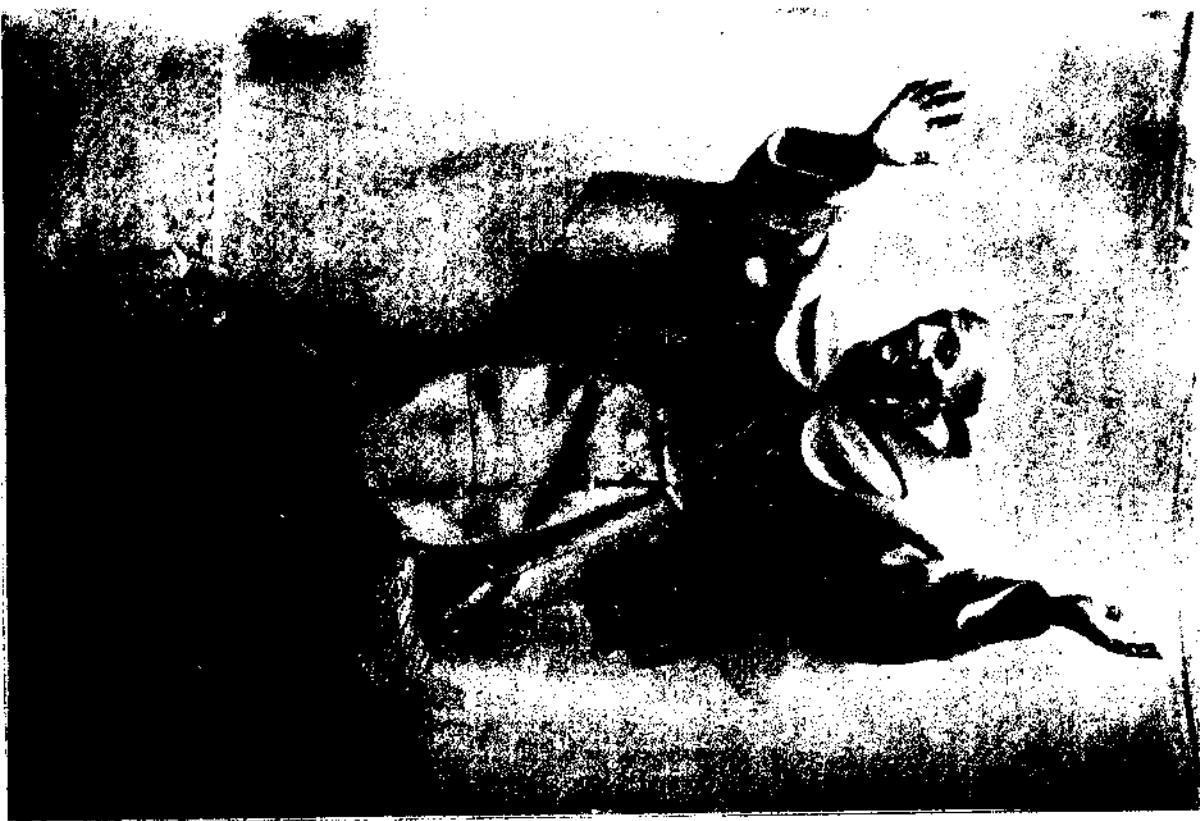
Templo de San Pascual Villarreal. Imagen de San Pedro de Alcántara, de Ignacio Vergara.