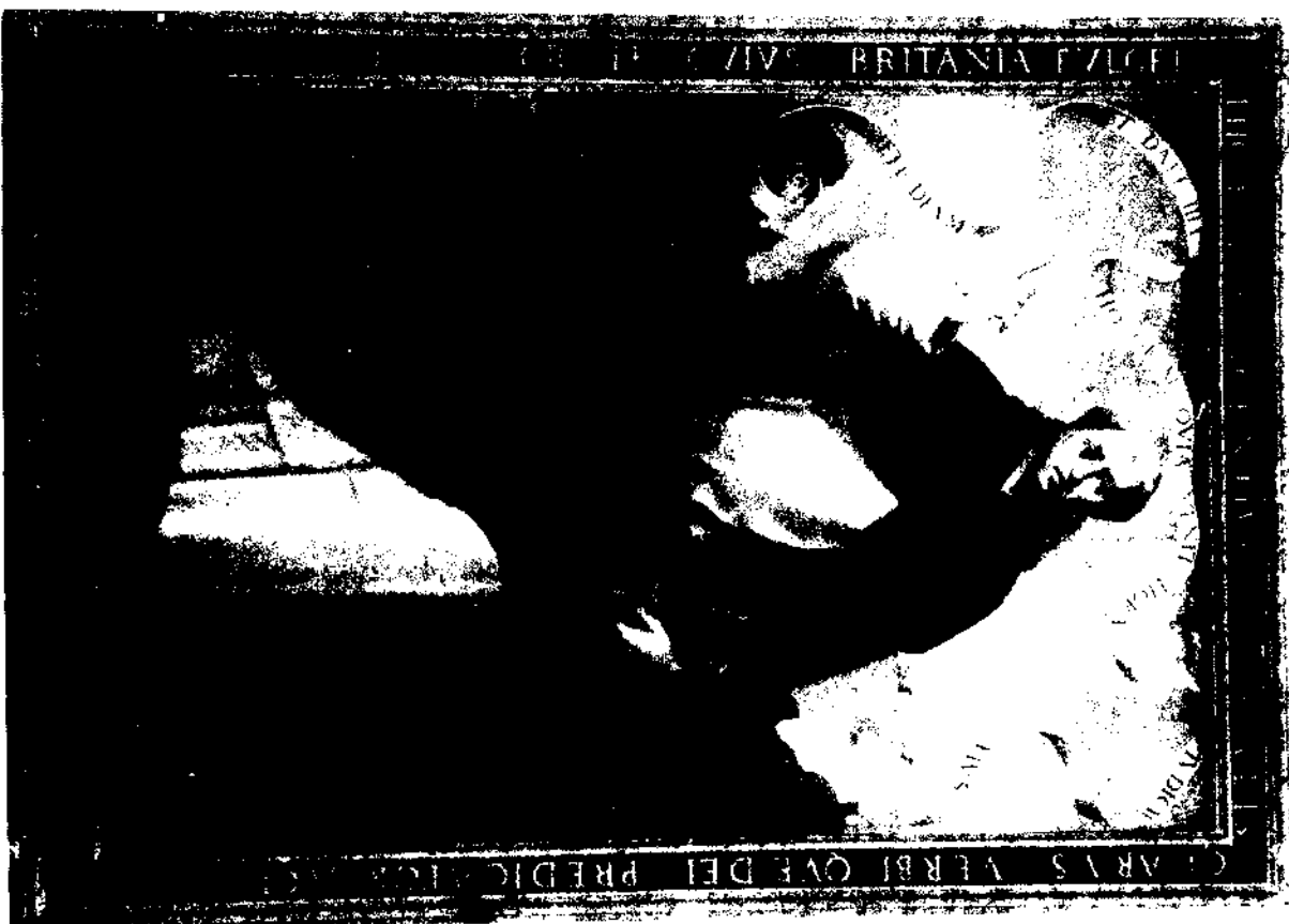
Iglesia arciprestal de Villarreal. San Vicente Ferrer.